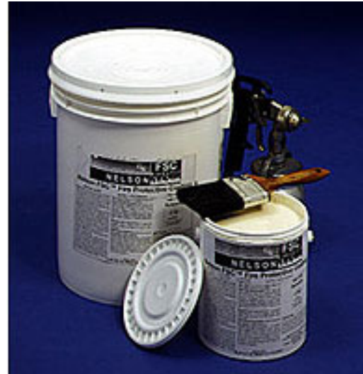
Cobertura Contrafogo FSC™